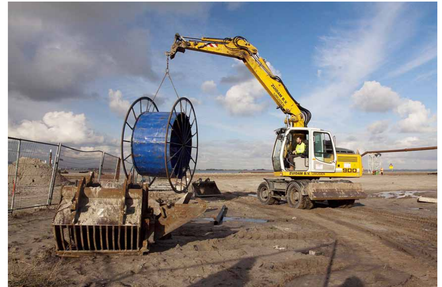
De werkzaamheden voor de inrichting van IJburg II, het Centrumeiland, zijn begonnen. Op de kop van het eiland verrijst het IJburgse strand en is plek voor de strandtent Blijburg.